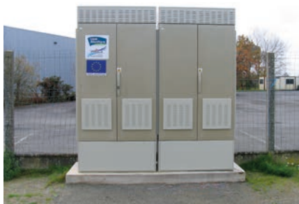
Le sous-répartiteur de la Croix Rouge

dans la zone industrielle de la Croix Rouge a permis d'avoir une vitesse de connexion égale ou supérieure à 2 Mbps.