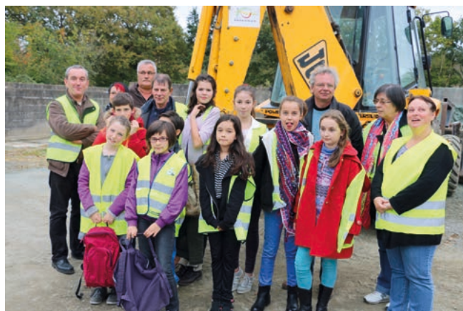
Visite des services techniques

Mercredi 11 novembre, 10 jeunes ont participé à la cérémonie de commémoration de la 1 ère guerre mondiale, devant le monument aux morts. Ils ont lu un à un les noms des 76 victimes de cette guerre 14-18, avec pour chacun son âge et le village d'origine.