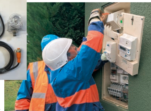
Pose d'horloge astronomique