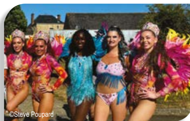
Danseuses brésiliennes de la troupe Meninas Do Sol (Nort sur Erdre).