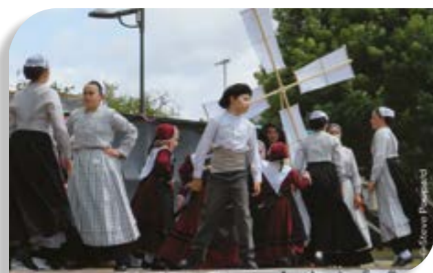
Cercle celtique de Guingamp, du cercle celtique de Malville et Guérande.

Au plaisir de vous retrouver à notre édition 2026.