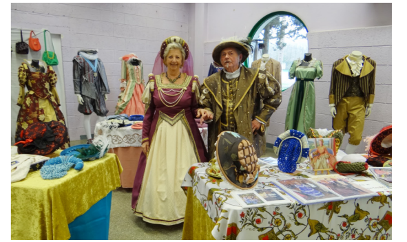
© HEMERY Mauricette & René - Costumes d'Inspiration Historique

Pour tous renseignements : contactez les organisateurs au 02 40 56 47 92 ou au 06 78 45 81 03.